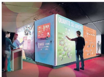
DAL 17 AL 20 OTTOBRE Quest'anno il festival della Statistica e della Demografia si concentrerà sul futuro dei dati in Europa

li tempestive e dettagliate che possano rispondere efficacemente a bisogni nuovi e inediti. Al centro, quindi, le statistiche in grado di orientare decisioni che vanno al di là dei confini nazionali su questioni come la coesione sociale, la crescita economica e il bisogno di contrastare i cambiamenti climatici. L'assunto è l'esigenza di ottenere dati credibili, rapidi e comparabili per valorizzare la statistica europea, e al tempo stesso di garantirne la qualità e la sicurezza. Nelle giornate del festival non mancheranno confronti, dialoghi, letture, laboratori, show e attività che, partendo da evidenze solide, avranno l'obiettivo di promuovere una maggiore consapevolezza da parte dei non addetti ai lavori